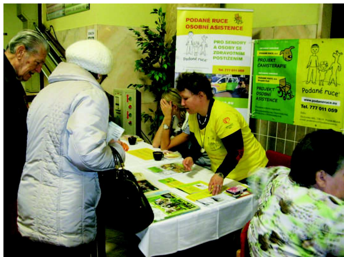
Gerontologické dny Ostrava - 16. 10. 2015. Pracovnice organizace informují o poskytovaných službách.

Mnoho „zdravých“ lidí si ani neuvědomuje, jak složitý je život v situaci, kdy nemůžete dělat každodenní obvyklé věci. Například - vstát ráno z postele, nasnídat se, umýt se, obléknout se a jít do práce či do školy. To je přece rutina... Co když to sám nezvládnou? Tyto starosti řeší i mnoho lidí v seniorském věku. Pokud se člověk ocitne v takové situaci, hledá pomoc.